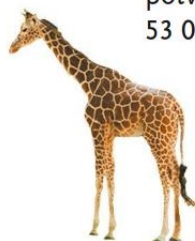
giraffe 1200 kg