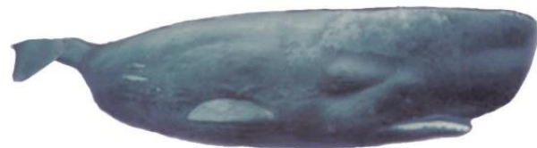
potvis 53 000 kg