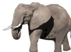
olifant 5000 kg

Bekijk het filmpje van dierentuin Artis: