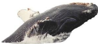
blauwe vinvis 130 000 kg